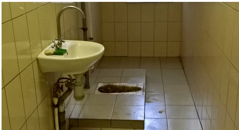
7 ОП: чаша «Генуя» в туалете

пать туалетную бумагу, мыло и полотенца за свой счёт.