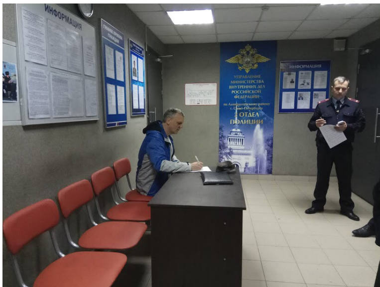
2 ОП: оборудование помещения для граждан (удобные стулья, место для написания заявлений, доступный стенд)

Наблюдатели оценивали состояние помещений для ожидания, их оснащённость мебелью, письменными принадлежностями, состояние и доступность туалетов. К сожалению, в этой части приходится констатировать отсутствие положительной динамики. Хотя состояние мест, где посетители ожидают приёма и составляют заявления, как и удобство размещения информации на стенде, во многом формируют образ полиции.