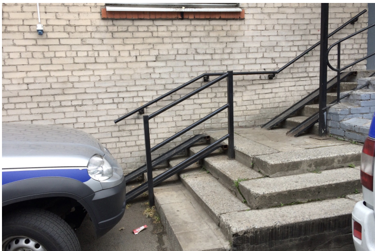
29 ОП: недоступный пандус перекрыт служебным автомобилем

Временным решением, позволяющим сделать ОП доступным для маломобильных посетителей до строительства или реконструкции пандуса, может стать установка кнопок вызова помощи на входе (как, например, в ОП №31). Но в 28 из 34 ОП звонок находится на высоте или в месте, которые недоступны колясочникам.