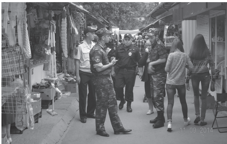
Общение сотрудников патрульно-постовой службы с гражданами в г. Волгодонске Ростовской области 11 сентября 2014 г.