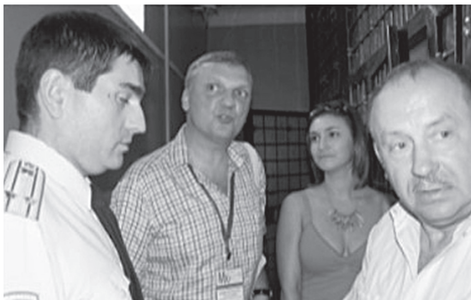
Сотрудники МХГ и представители общественного совета при МУ МВД России «Одинцовское» проводят посещение отдела полиции в Одинцовском районе Московской области 1 августа 2014 г.