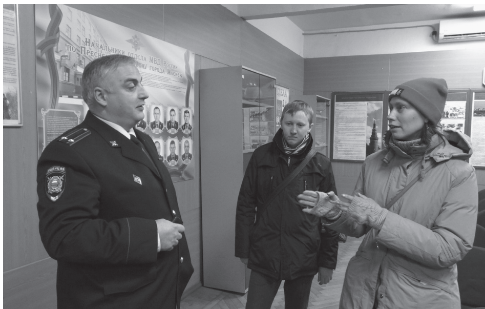
Посещение ОМВД России по Пресненскому району г. Москвы в рамках учебного семинара МХГ 17 декабря 2013 г.