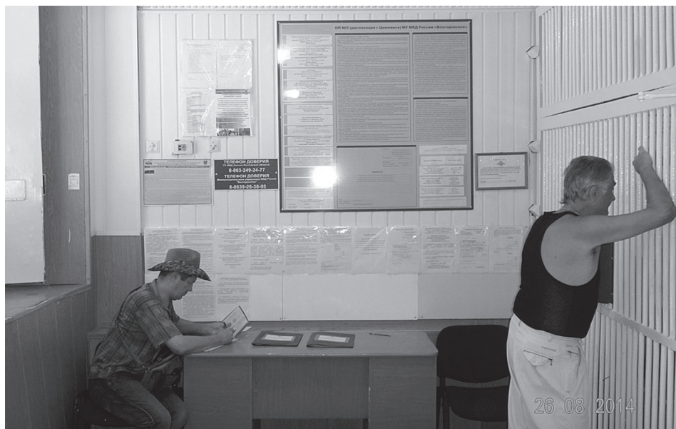
Посещение отдела полиции в Ростовской области