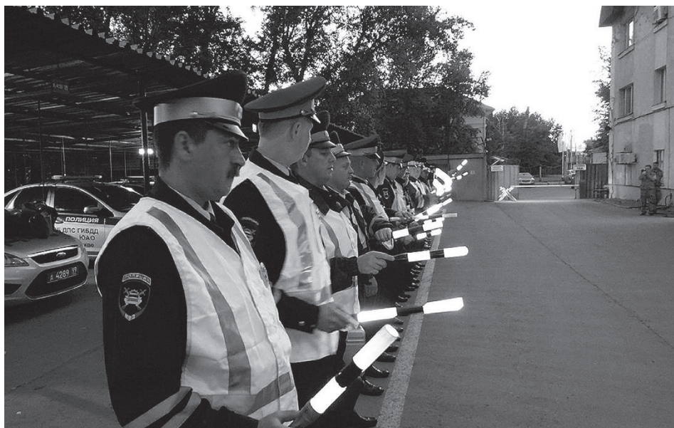
Проверка готовности сотрудников спецбатальона ДПС ГИБДД Южного административного округа г. Москвы к рейду «Трезвый водитель» 11 июня 2014 г.