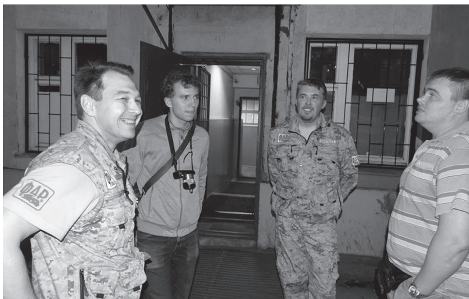
Активисты Федерации автовладельцев России и сотрудники МХГ участвуют в ночном рейде «Трезвый водитель» совместно со спецбатальоном ДПС ГИБДД Южного административного округа г. Москвы 11 июня 2014 г.