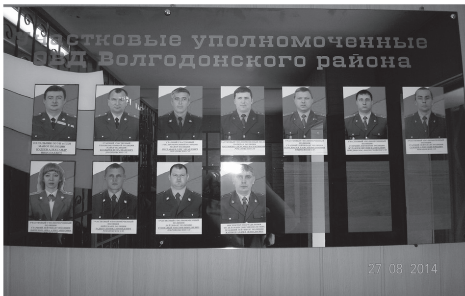
Информационный стенд с участковыми уполномоченными полиции ОВД Волгодонского района Ростовской области 27 августа 2014 г.