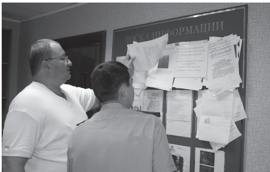
Посещение участкового пункта полиции в Самарской области. Август 2014 г.