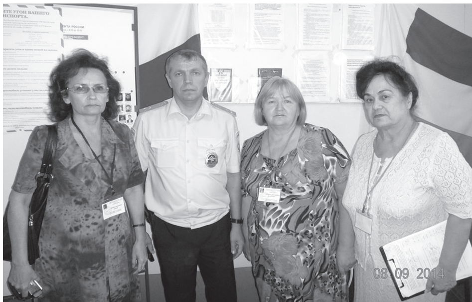
Гражданские активисты Ростовской области посещают участковый пункт полиции 8 сентября 2014 г.