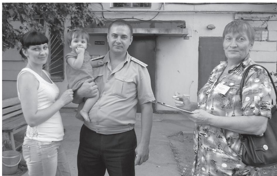
Общение участкового уполномоченного полиции пункта полиции № 5 МУ МВД России «Волгодонское» с жителями города 25 августа 2014 г.