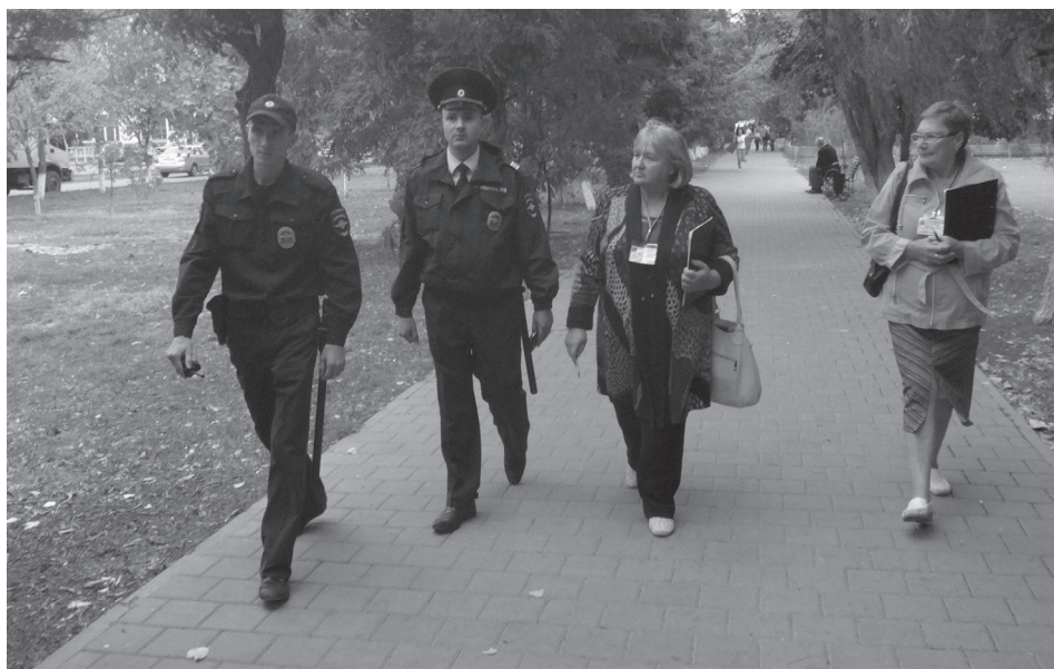
Гражданские активисты проводят мониторинг работы сотрудников патрульно-постовой службы в г. Волгодонске Ростовской области 11 сентября 2014 г.