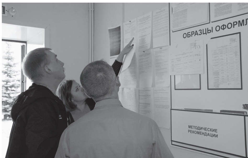
Посещение гражданскими активистами участкового пункта полиции в Самарской области в августе 2014 г.