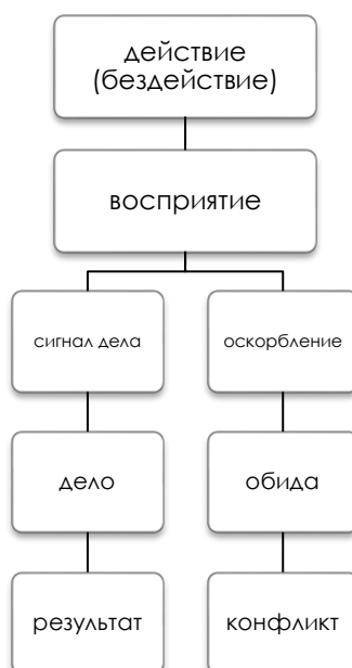
Схема 2. Альтернативы восприятия действия

Итак, если действие «передатчика» запустило конфликт, то есть включило у «приемника» механизм защиты собственного достоинства, его можно назвать конфликтогеном .